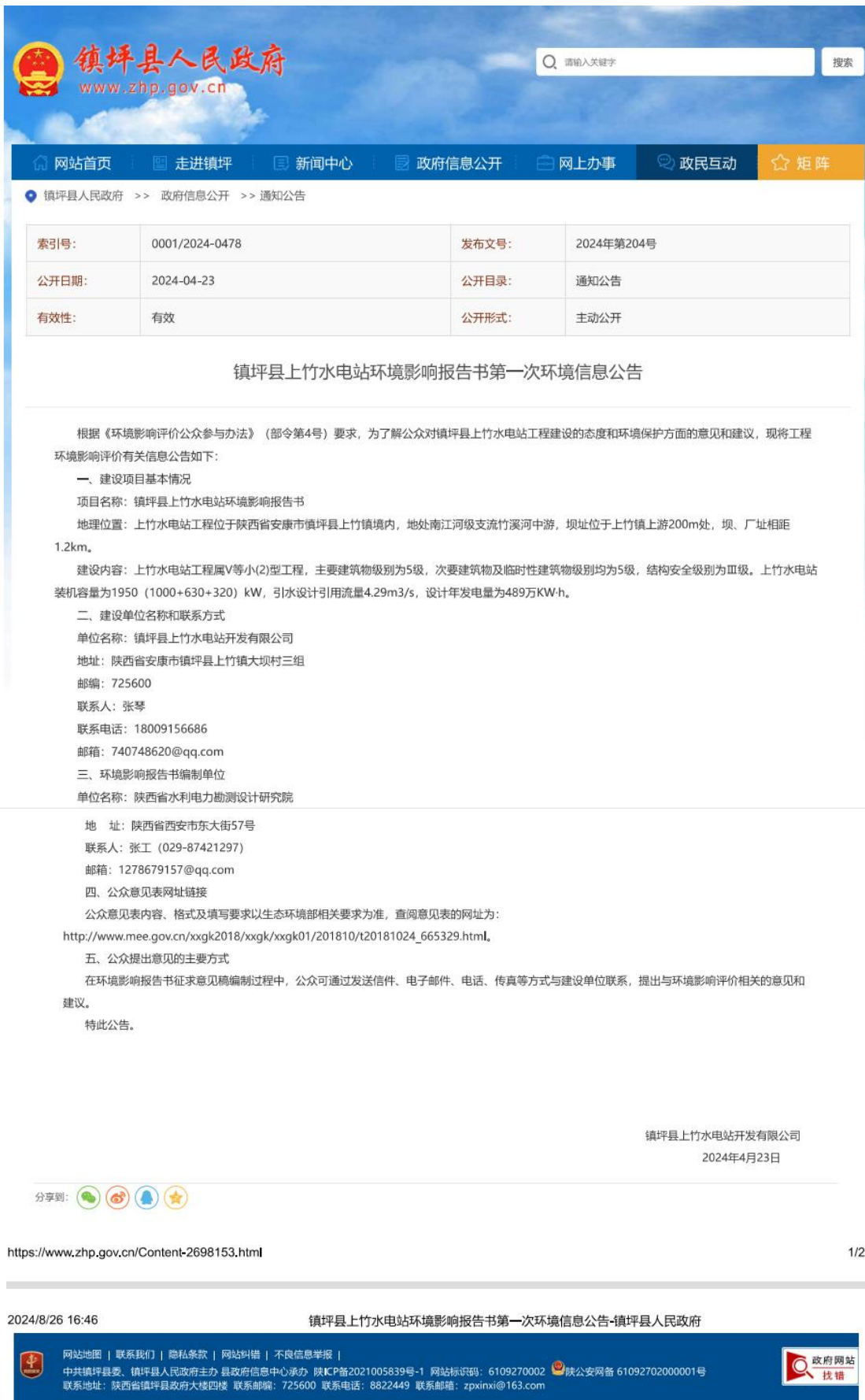
图 2.2-1 环境影响评价第一次公示网页截图