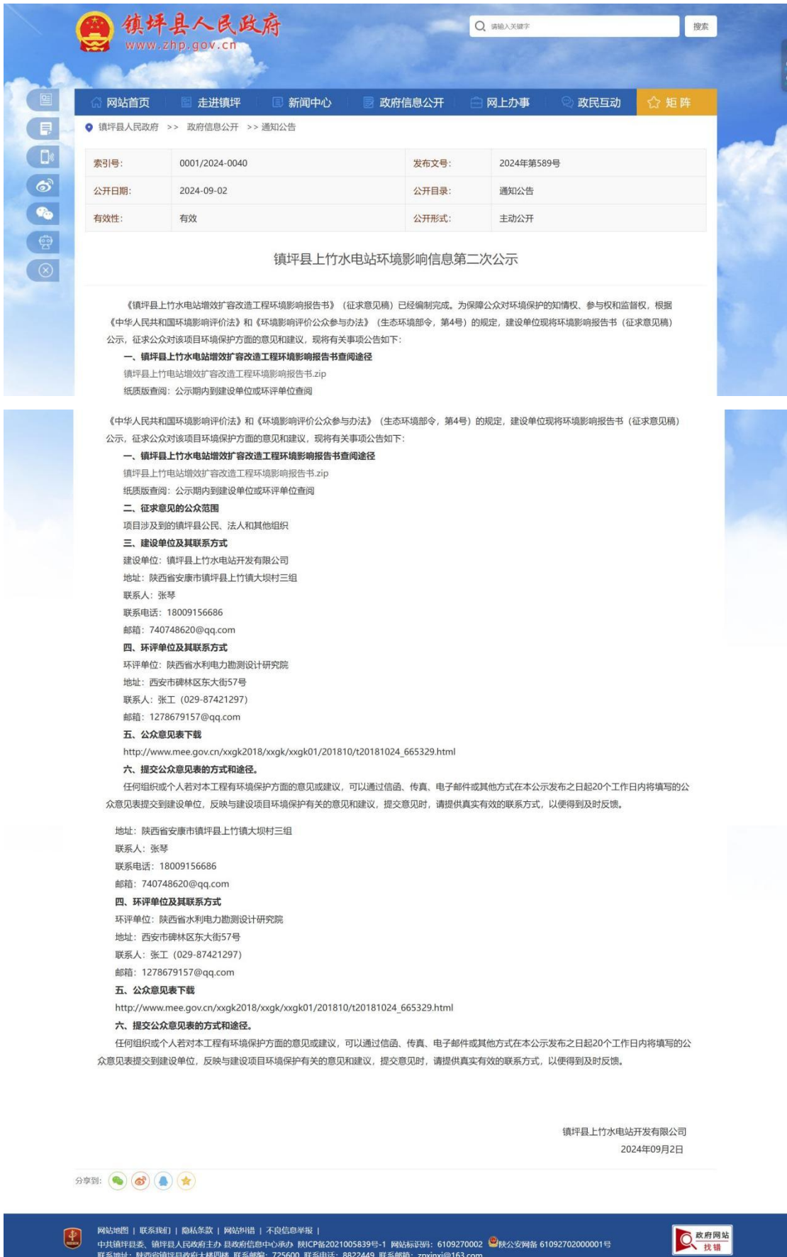
图 3.2-1 环境影响评价第二次公示网页截图