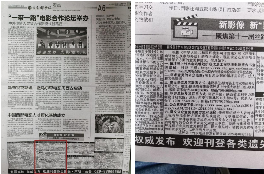
图 3.2-5 2024 年 9 月 23 日报纸公示