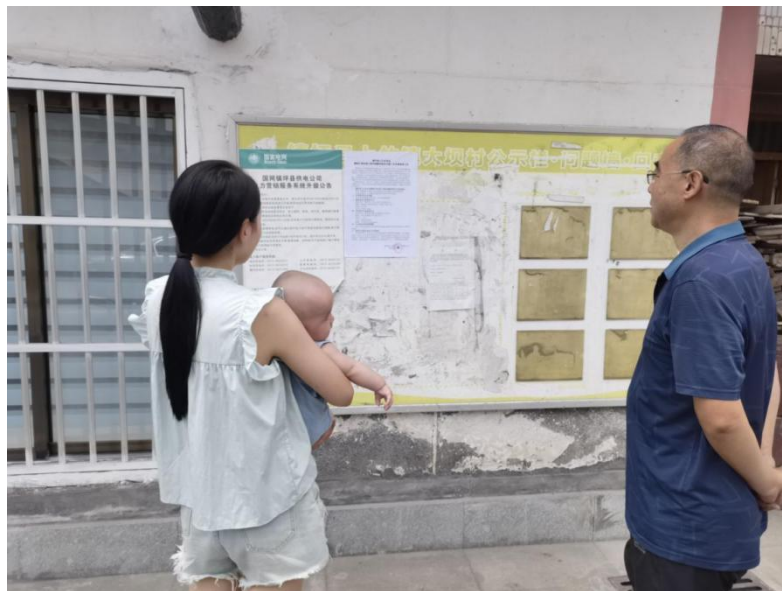
图 3.2-3 本工程环境影响信息第二次公示（现场张贴）