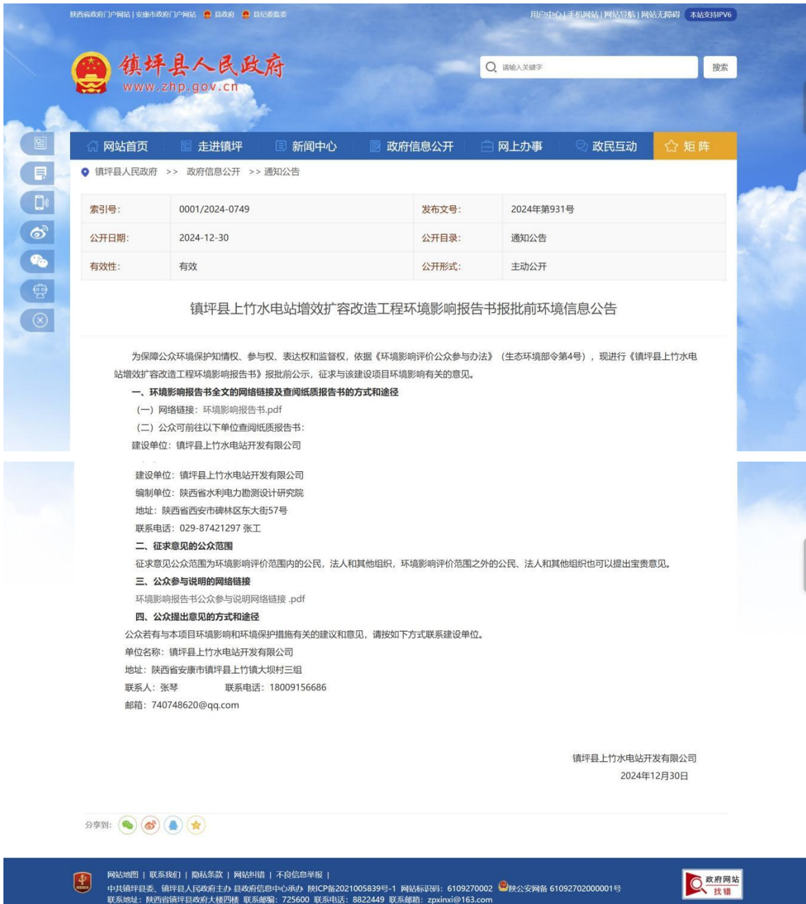
图 6.2-1 本工程环境影响信息报批前公示网络截图