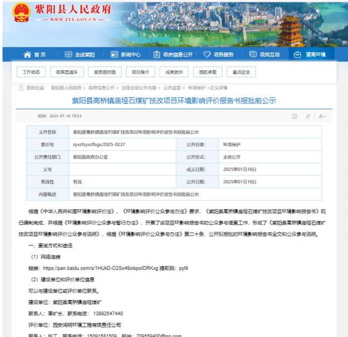
图 8-1 报批前公示截图