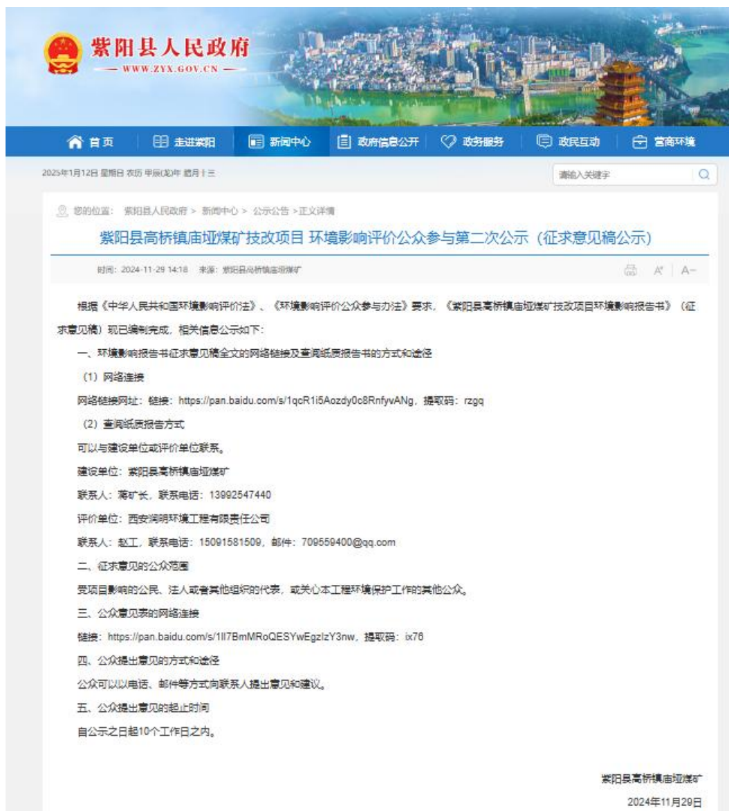
图 3-1 征求意见稿公示网络截图

网络公示选择在紫阳县人民政府官方网站进行公示，网络公示时间为2024年11月29日~12月13日，链接为：紫阳县人民政府—新闻中心—公示公告 https://www.zyx.gov.cn/Content-2770053.html ，网络截图见下图。