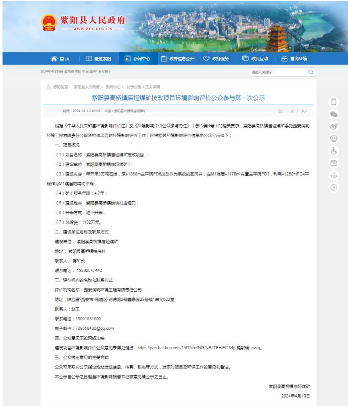
图 2-1 环评信息首次公开网络截图