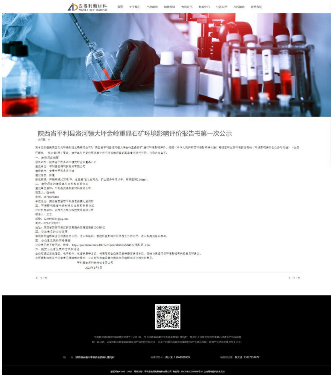
图 2.2-1 一次公示截图