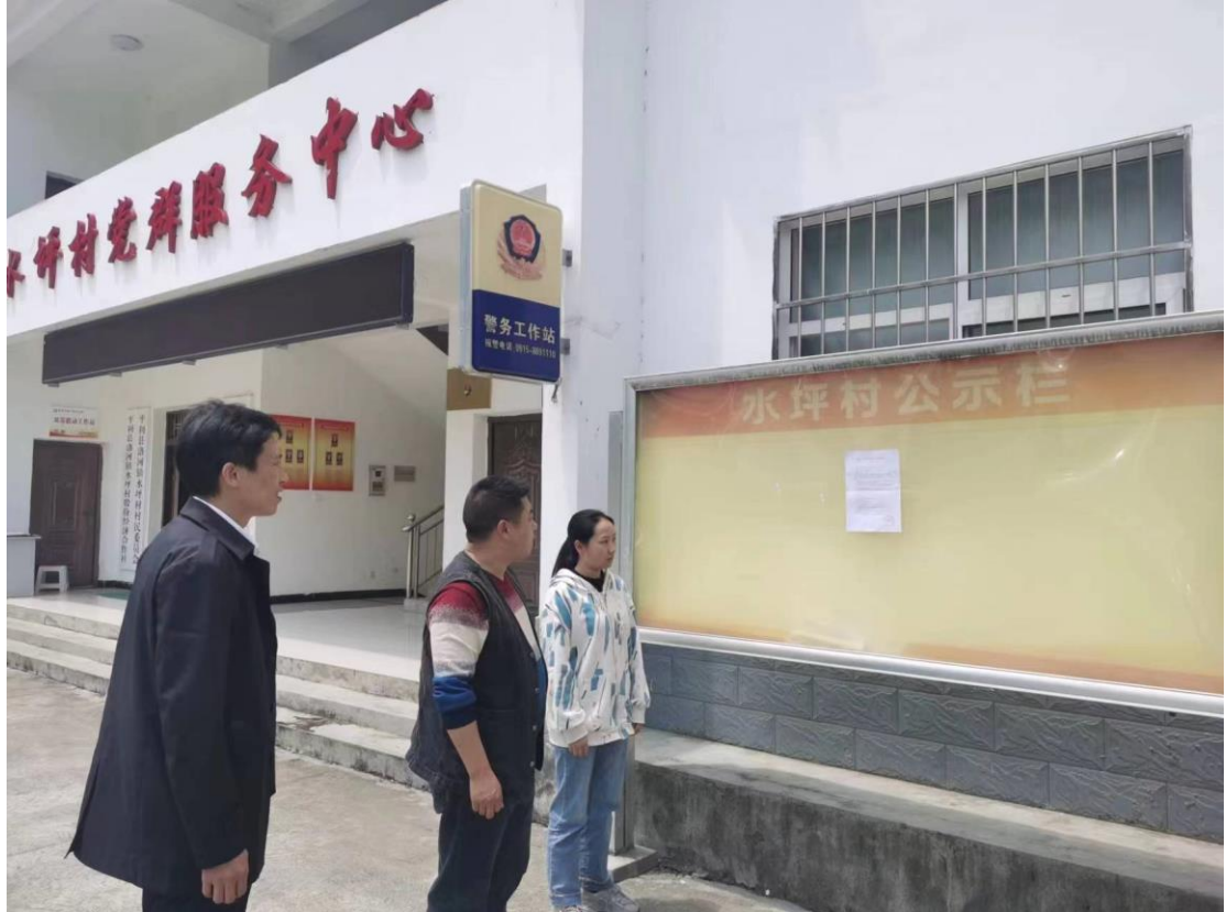
图 3.2-4 公示张贴现场照片