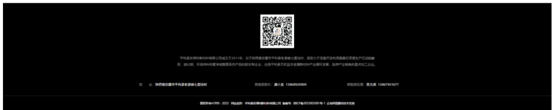
图 3.2-1 二次公示网络截图